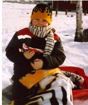
En blivande junior kanske?