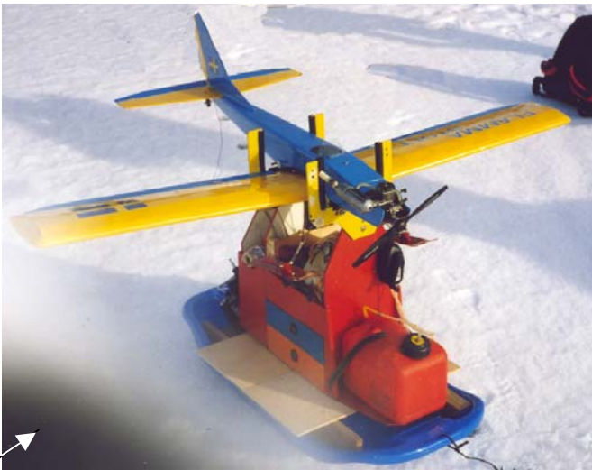
Sverker Norelius mobila meklåda